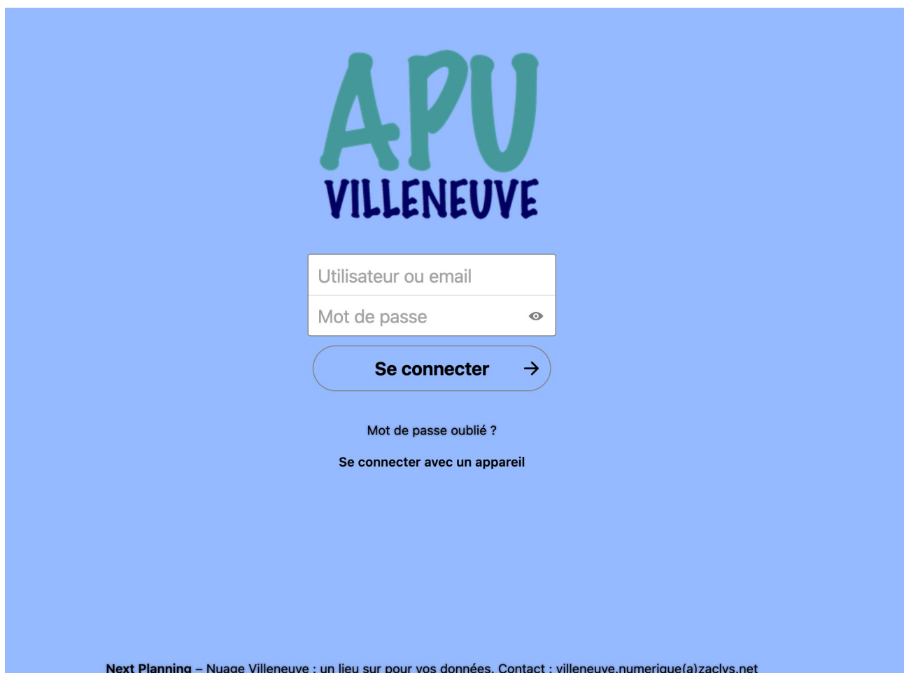
Page d'accueil du Nuage Villeneuve

Grâce à l'appui de Dunia.cc, l'association Next Planning a mis en place un outil de partage de documents, de dossiers à destination des habitants et des associations de la Villeneuve.