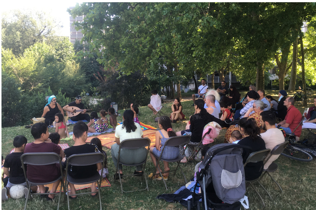
Conte de l'associatino Beyti à l'occasion de Villeneuve 2020

"Après ces longues semaines de confinement, nous avons tous le désir de nous retrouver au grand air, de discuter avec nos voisins à l'ombre d'un arbre, de se détendre pendant quelques heures, de retrouver notre LIBERTE ! Comme chaque année, Villeneuve Plage propose de rassembler et se retrouver au bord de l'eau pour se réapproprier l'espace public, pour prendre soin de soi, des autres, de notre quartier, de notre ville. Tout au long de l'été, les associations de Villeneuve et d'ailleurs ont prévu des activités, des ateliers, des contes, des démonstrations, des spectacles, des concerts, une buvette pour se rafraichir et des petits plats à déguster. Venez, seul ou en famille, avec vos voisins de 16h à 21h pour profiter des longues journées, des après-midis ensoleillés et des douces soirées d'été !