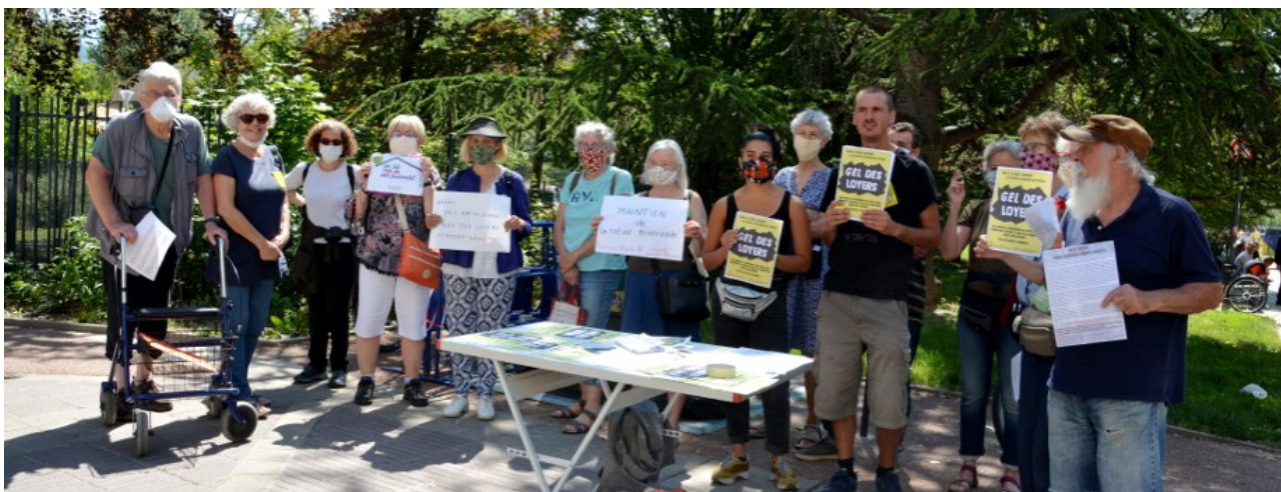
Lancement de l'enquête populaire à la Villeneuve

Suite aux actions sur le moratoire, la stratégie de l'Atelier Populaire d'Urbanisme (APU) et du collectif RIC Arlequin a été de réaliser une enquête populaire pour essayer de mesurer les difficultés financières et les pertes de revenus 5 .