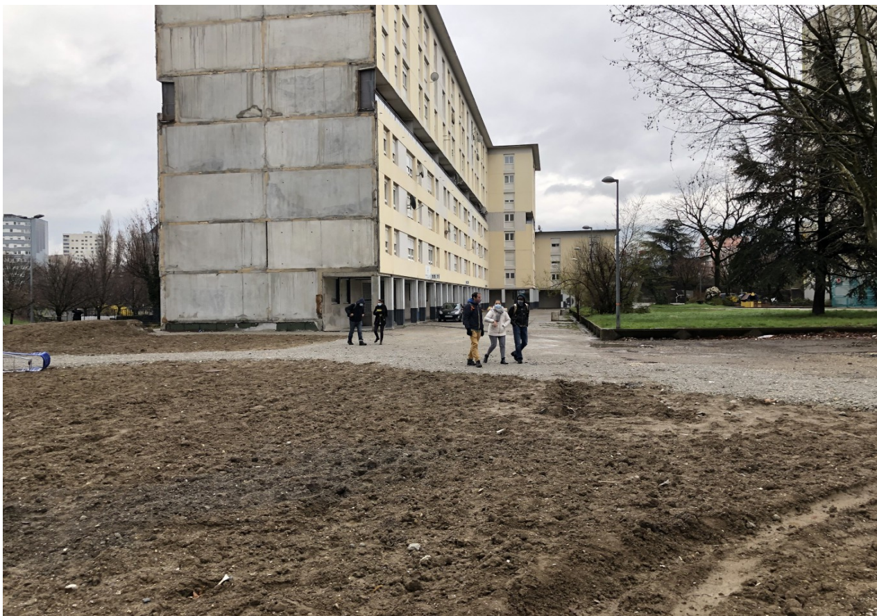
Visite de terrain après la démolition d'un immeuble à Echirolles

d'évaluer de façon critique ses impacts sur la société civile et le tiers secteur et la production d'un «urbanisme solidaire de la transition». Le projet aborde trois questions de recherche principales: sur la genèse et les conditions de développement de ces collaborations; sur les relations entre les contextes politico-institutionnels et les configurations organisationnelles des pratiques collaboratives et sur l'organisation et la circulation des savoirs au sein de ces collaborations et le rôle joué par les acteurs intermédiaires.