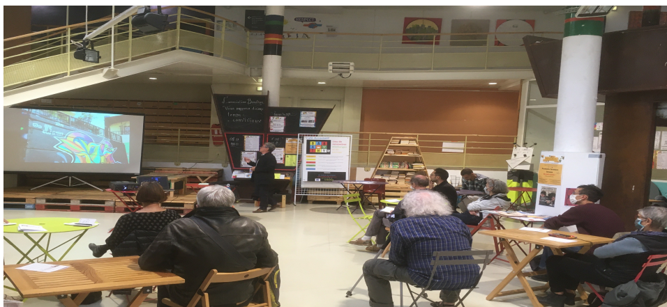
Séance Réinventer la prévention

L'association a fait le choix de prendre une part plus active au sein du collectif inter-associatif Villeneuve Debout. L'objectif était de renouveler notre engagement avec le collectif inter-associatif qui avait porté l'Atelier Populaire d'Urbanisme (APU) au cours de la première année. L'association a rejoint le conseil d'administration lors de l'assemblée générale du 10 décembre 2019 puis nous avons participé à de nombreux conseils d'administrations tout au long de l'année.