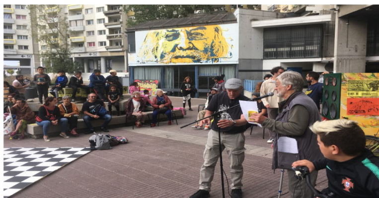
PROPOSITIONS DE L'ATELIER POPULAIRE D'URBANISME (APU)