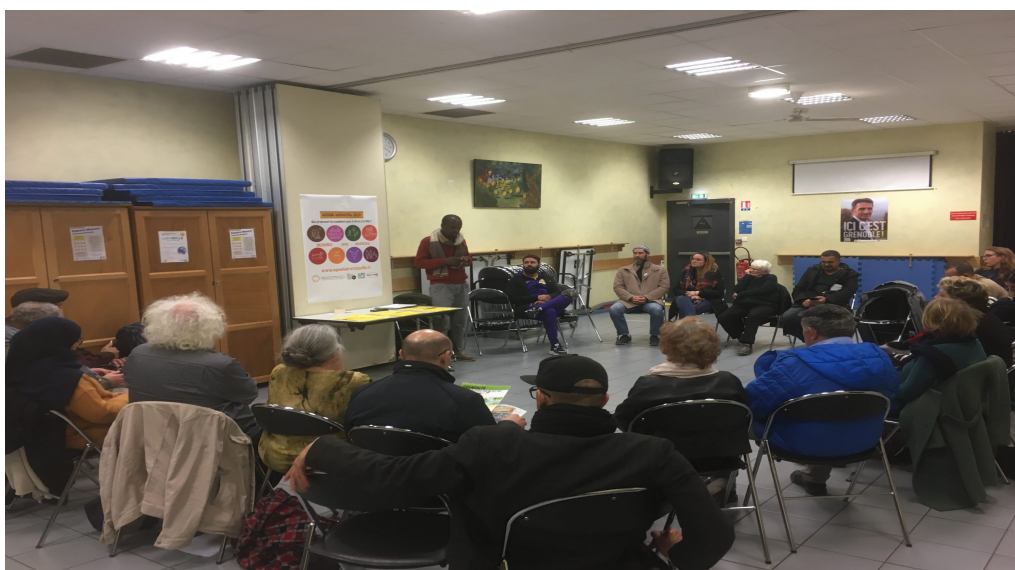
Présentation de l'Agenda pour le Droit à la Ville

À Grenoble, l'Agenda pour le Droit à la Ville a favorisé l'émergence de nombreux initiatives de Plaidoyer regroupant environ 150 propositions. Parmi ces initiatives, Le plaidoyer pour Villeneuve de l'Atelier Populaire d'Urbanisme a rassemblé une quarantaine de proposition pour poursuivre la transformation urbaine de ce quartier emblématique. Tout au long de la campagne l'Agenda pour le Droit à la Ville a été présenté aux candidats et aux assemblées citoyennes. L'initiative a été discuté au sein de la quatrième assemblée des communs de Grenoble qui s'est déroulé le 31 Janvier 2020. Cette assemblée a soutenu les propositions du cahier de propositions en contexte municipal en particulier sur les politiques foncières. Les propositions sur l'arrêt des démolitions de logements sociaux et la mise en oeuvre de référendum d'initiative citoyenne (RIC) ont été reprises par la liste citoyenne "la Commune est à nous ». tandis que la proposition de 30% de logements sociaux en 2030 a été repris par la liste Grenoble en Communs autour d'Eric Piolle.