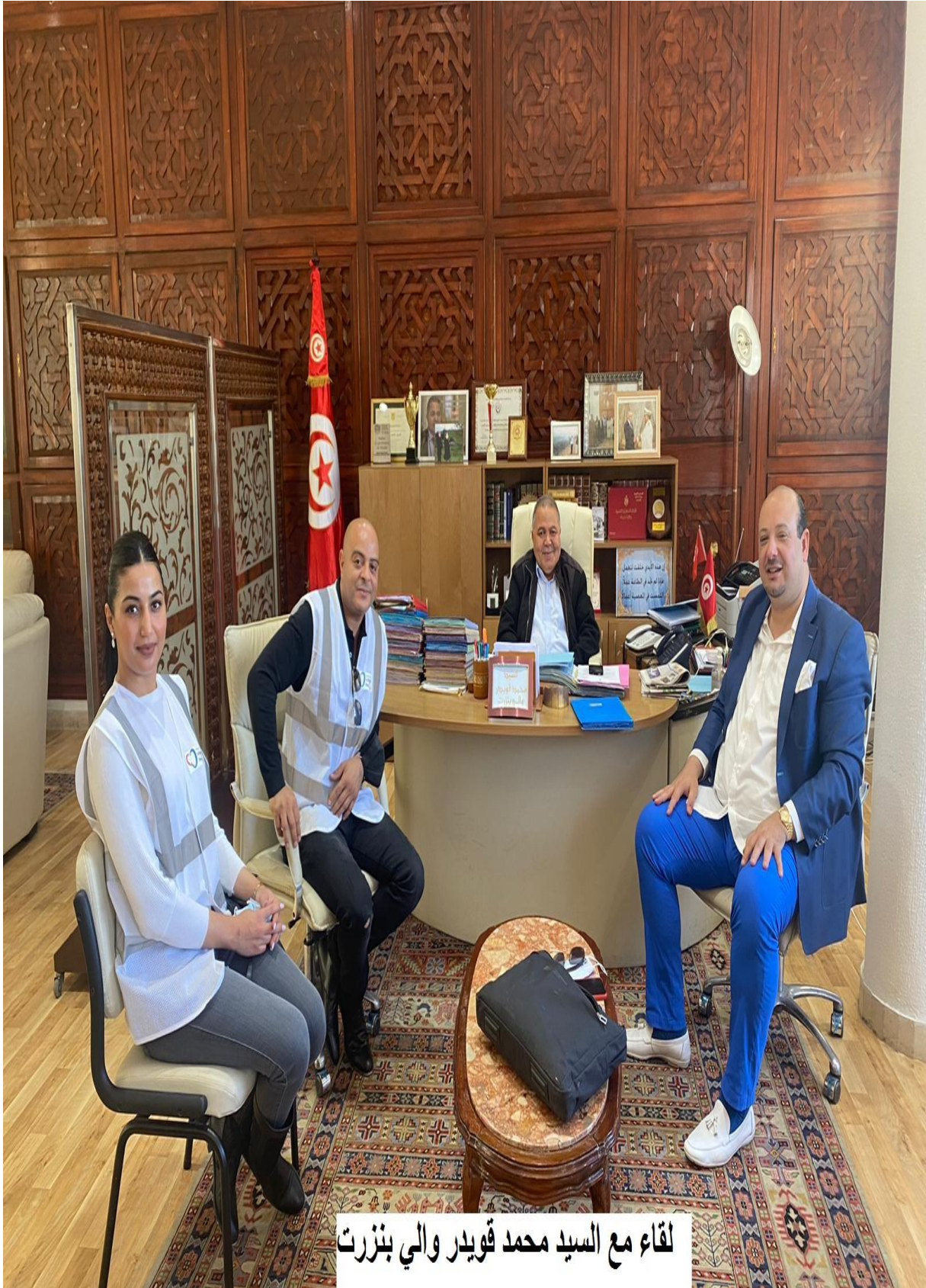
لقاء مع السيد محمد قويدر والي بنزرت