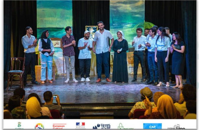
(مقتطفات من مسرحية صيف/شتا)