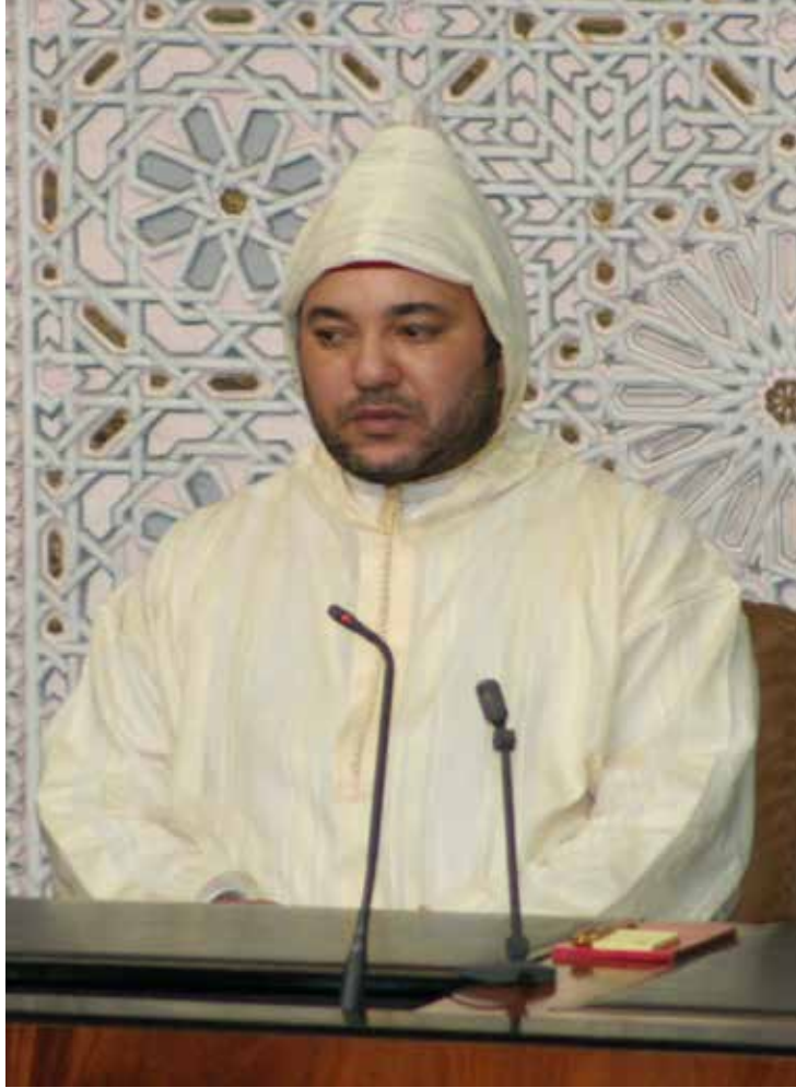
صاحب الجلالة الملك محمد السادس نصره الله