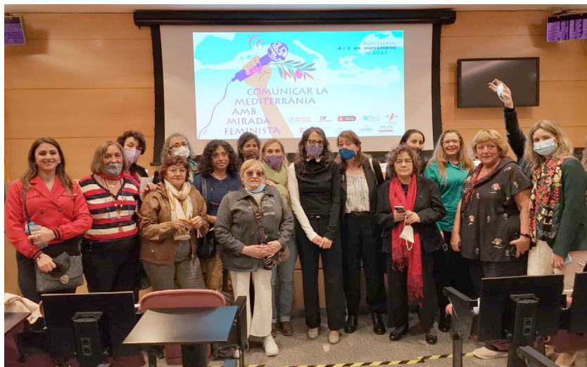
Foto final amb la consellera d'Igualtat i Feminismes, Tània Verge.