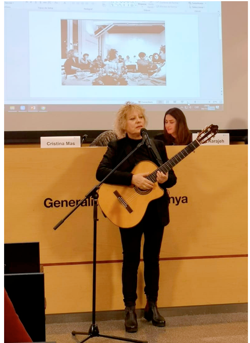
Actuació de Marina Rossell.